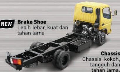
Chassis Chassis kokoh, tangguh dan tahan lama.

NEW Brake Shoe Lebih lebar, kuat dan tahan lama