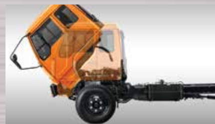
Kabin Jungkit Mudah dalam pemeriksaan dan perawatan mesin.