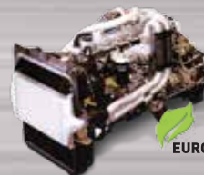
MESIN 6D16-3AT2 TURBO INTERCOOLER Mesin Legendaris, Terkenal Tangguh, Kuat Dan Mudah Perawatan.