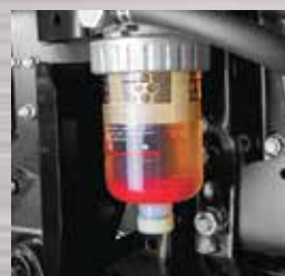
Transparent Water Separator Mempermudah dalam melakukan pemeriksaan kondisi bahan bakar dan air.