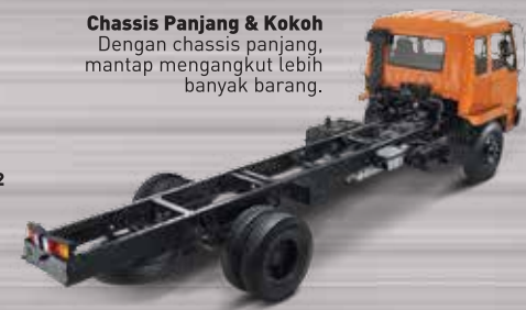
Chassis Panjang & Kokoh Dengan chassis panjang, mantap mengangkut lebih banyak barang.