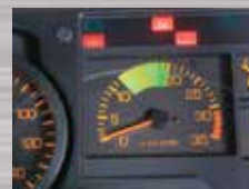
Tachometer Mempermudah penyetaraan putaran mesin dengan kecepatan kendaraan, agar irit BBM.