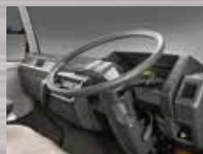
Power Steering + Tilt Steering Posisi roda kemudi dapat diatur sesuai postur pengemudi.