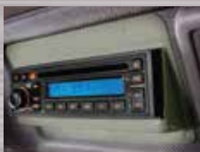
Radio/CD/MP3 Menambah kenyamanan di sepanjang perjalanan.