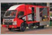
Mobile Workshop Service